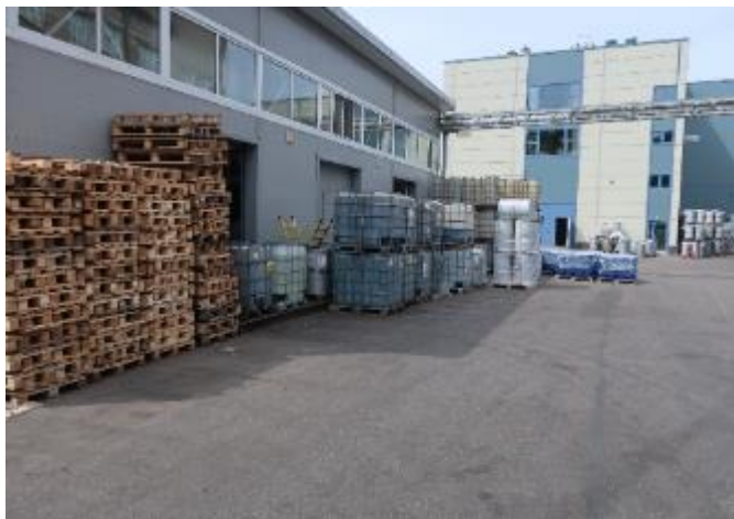
Фото 1 - 2. Наружный вид цеха производства смазок, погрузка продукции