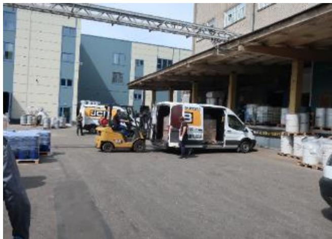
Фото 3 - 6. Хранение сырья, полупродуктов и готовой продукции