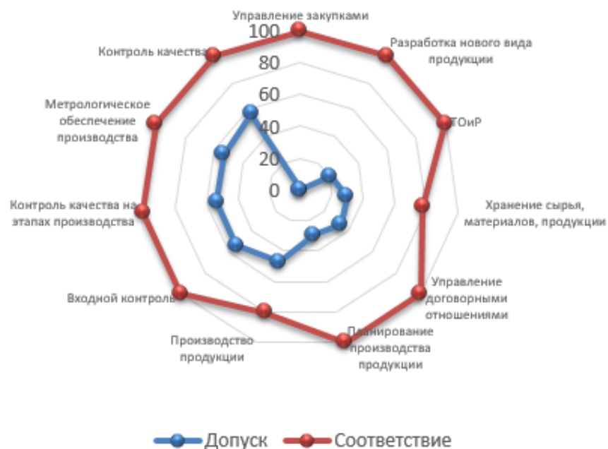
Оценка соответствия контрагента заданным критериям (%)